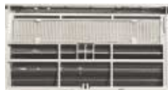
Actieve kool filter